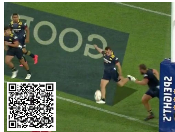
Calcio di rinvio dalla linea di meta durante la partita di Super Rugby Aotearoa tra Highlanders e Crusaders. Al link seguente il video del calcio, (inquadra il Qrcode) https://www.rugbydump.com/news/first-super-rugby-aotearoa-goal-line-drop-out-sets-up-amazing-finale-in-tournament-opener/

Il regolamento è articolato, ma in sintesi, il calcio deve essere battuto senza ritardi, deve superare la linea dei 5 metri e non andare direttamente in touche; pena mischia sui 5 o touch per l'altra squadra. Il calcio non può essere ostacolato da un avversario, pena calcio di punizione a favore di chi calca.